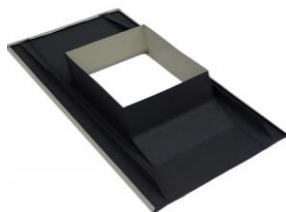
"Обход трубы в технике двойного фальца"